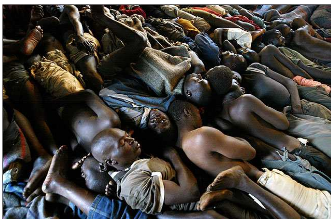
prison au Malawi