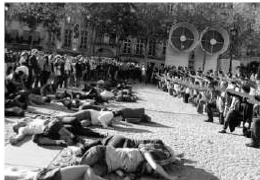
Photo : flash mob organisée à Paris pour la Journée mondiale du 10 octobre 2010.

Voir la vidéo http://www.youtube.com/user/AssociationECPM