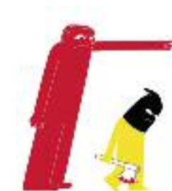
« Adieu ! », Poster 4 Tomorrow, Jochen Schievink, Allemagne.

L'exécution par lapidation est considérée comme une « méthode d'exécution particulièrement cruelle ou inhumaine » par le Comité des droits de l'homme de l'ONU.