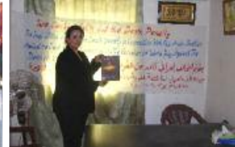
« Nous pouvons vivre sans la peine de mort ». Réunion à Bagdad, Irak, pour la Journée mondiale 2010.

Bien que des exécutions continuent d'être menées dans de nombreuses régions à travers le monde, la tendance générale vers l'abolition s'accroît. Chaque année moins d'exécutions ont lieu et moins de personnes sont condamnées à mort.