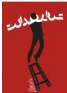
« JUSTICE/EDALAT », Poster 4 Tomorrow, Aida Torkamani Asl, Iran.