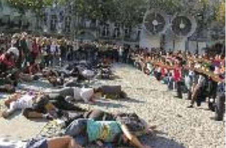
Flash Mob à Paris, France, octobre 2010.