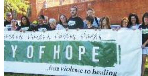
Rassemblement au Texas, Etats-Unis, pour la Journée mondiale 2010.

Selon le Death Penalty Information Center, « des psychologues et des avocats aux États-Unis et ailleurs ont fait valoir que des périodes prolongées dans les confins du couloir de la mort peut rendre les détenus suicidaires, délirants et fous ». Certains ont évoqué les conditions de vie dans les couloirs de la mort - l'isolement et les années sombres de l'incertitude quant au jour de l'exécution - comme le « phénomène des couloirs de la mort ».