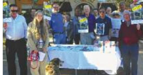
Rassemblement en Californie pour la Journée mondiale 2010.

En 2010, 23 pays à travers le monde ont procédé à des exécutions. La Chine, l'Iran, la Corée du Nord et les États-Unis sont les pays qui exécutent le plus au monde. Il y a eu 2 024 nouvelles condamnations à mort prononcées dans 67 pays en 2010, selon Amnesty International. Il reste encore beaucoup de secret entourant la peine de mort dans le monde entier et de nombreux gouvernements ne diffusent pas ces informations aux institutions gouvernementales internationales ou aux ONG.