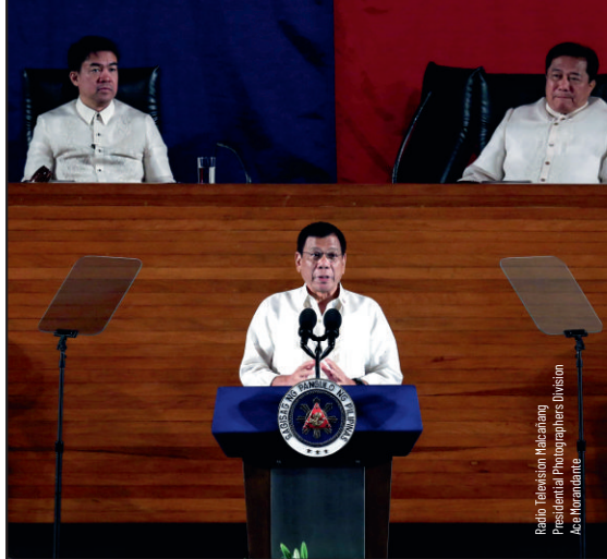
Paghatid ng unang SONA ni Pangulong Duterte noong Hulyo 2016.

Kailangang aprubahan ng Komite sa Hustisiya (Committee on Justice) ang mga panukang batas upang maipasa ito sa plenaryo. Kapag napasa na