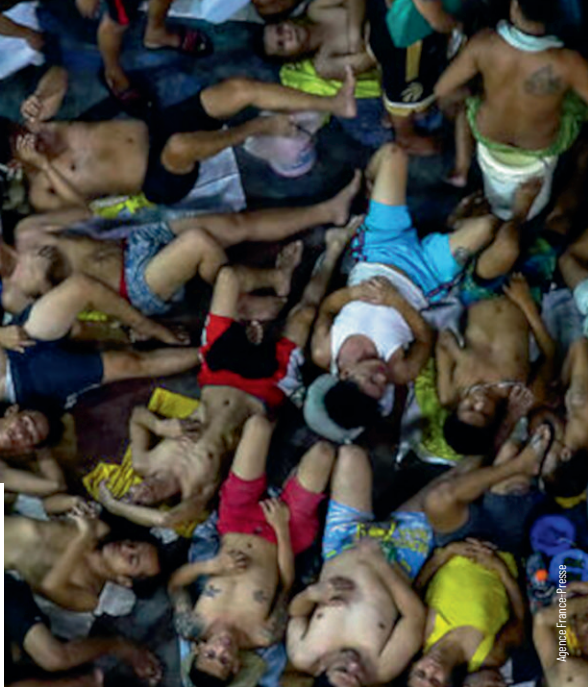
Mga presong natutulog sa masikip na bilangguan sa Lungsod ng Quezon, Maynila