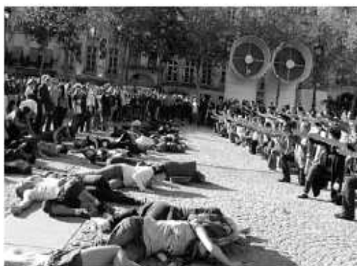
Photo: Flash Mob, Paris, 10 Octobre 2010.

Taiwan Alliance to End the Death Penalty organise tous les trois ans depuis 2004 un festival de film sur la peine de mort.