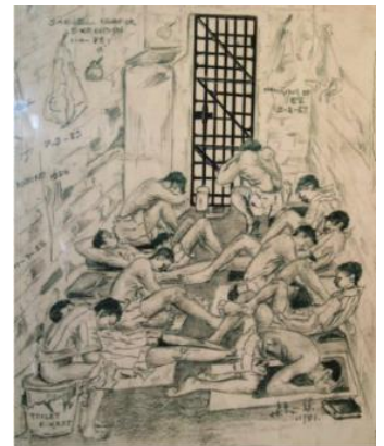
Notre vilain monde, Arthur Angel